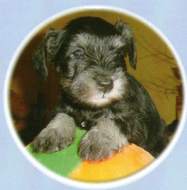
Der Zwergschnauzer ist eine runde Sache!

Der Zwergschnauzer ist ein charaktvoller, treuer Begleiter, der täglich seine Bewegung genießt und als Begleit- und Familienhund überzeugt. Er ist ein unbestechlicher Wächter für Haus und Heim, dabei kein Kläffer. Robustheit und Ausdauer zeichnen den kleinen, kräftigen, eher gedrungenen als schlanken, rauhaarigen Zwergschnauzer aus. Im großen und ganzen entsprechen seine Wesenszüge denen des Schnauzers und werden durch Temperament und Gebaren noch verstärkt, und zwar ohne die psychischen Merkmale eines Zwerghundes – das zeichnet den Zwergschnauzer aus. Auch ist der Zwergschnauzer ein begeisterter Sporthund, THS & Agility liebt er, er kann es kaum erwarten, bis es los geht, wenn er einmal reingeschnuppert hat!